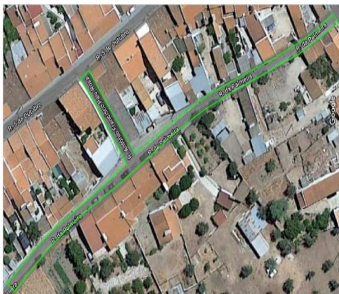
Rua da Palmeira e Rua Antonio Pais Rosa - área a pavimentar = 760.00 m 2