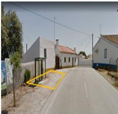
Rua de Évora - área a pavimentar = 40.00m 2