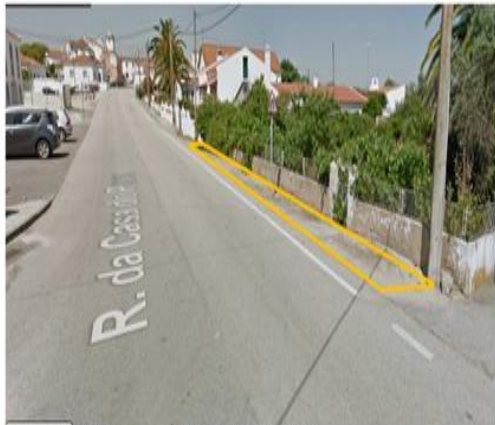
Rua da Casa do Povo - Área a pavimentar = 70.00m 2